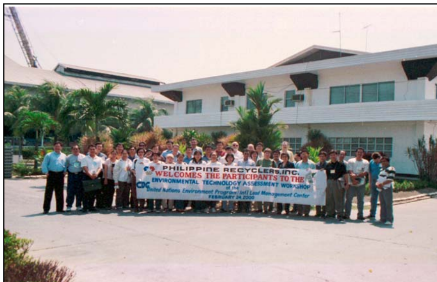
El Taller de Valoración de Tecnología

Al momento de recibir una solicitud de asistencia de una entidad gubernamental o de un sector industrial para iniciar un programa de manejo del riesgo del plomo, el ILMC asigna un "Equipo de manejo del riesgo" para que se encargue de reunir, compaginar y analizar toda la información disponible. Este proceso siempre incluye varias reuniones entre los representantes del equipo del ILMC, las entidades gubernamentales, la industria y la comunidad. El marco de consulta en el que se desenvuelven las partes interesadas se basa en una relación de subsidiariedad entre las mismas. Se toma en consideración y se analiza cabalmente la amplia gama de opciones para el manejo del riesgo del plomo, incluidos los costos y beneficios, con el fin de formular las medidas necesarias para establecer un programa eficaz.