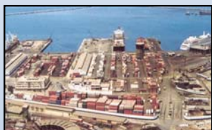
El puerto de Callao, Perú