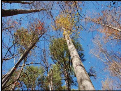
Research Triangle Park, Carolina del Norte, EE.UU.

Los términos de referencia y las actividades del Centro cuentan con el respaldo del Directorio Ejecutivo integrado por los representantes de las compañías patrocinadoras. El Grupo de Asesoramiento en Política tiene la responsabilidad de guiar y dirigir el establecimiento de prioridades, así como determinar la viabilidad de los proyectos y programas de acción. El Grupo está compuesto de expertos independientes que poseen experiencia internacional y conocimientos especializados en las siguientes áreas: