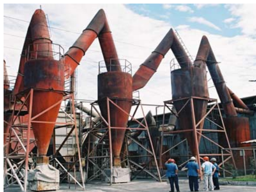
La planta de filtración de polvo