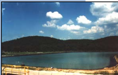
Manejo de aguas residuales